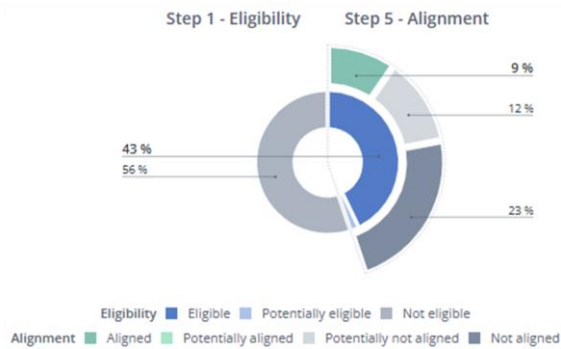
1. Alignement des investissements sur la taxinomie, dont obligations souveraines*